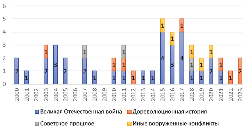
Динамика установки мемориалов в Петрозаводске (составлено авторами)