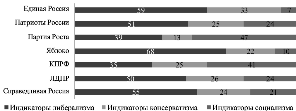
Рис. 2. Индикаторы идеологий в программах партий 2016 г., % от общего количества упоминаний

Если интерпретировать этот результат в терминологии М. Селиджера [8], то можно сделать вывод о массовом и довольно циничном принесении идеологической «чистоты» в жертву оперативной задаче выиграть выборы. Если интерпретировать результат в классификации политических партий [3], то можно констатировать, что большинство партий не являются партиями мобилизационного типа. Примечательно, впрочем, что обработка программ политических партий 2016 г. фиксирует как количественно наблюдаемое увеличение объемов «идеологических» текстов, так и тяготение к риторике либерализма (рис. 2).