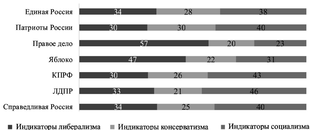
Рис. 1. Индикаторы идеологий в программах партий 2011 г., % от общего количества упоминаний

Напомним логику и основные результаты наших предыдущих исследований. Мы вслед за И. Валлерстайном [2] предположили, что при всем многообразии ответвлений идеологические программы могут быть сведены к трем макро-идеологиям модерности — либерализму, консерватизму и социализму. Соотнеся ценности каждой из трех крупных идеологий со словами-индикаторами (10 ценностей, 230 слов-индикаторов), мы создали инструмент контент-анализа и последовательно применили его к программам политических партий РФ, претендовавших на места в Государственной думе в электоральных циклах 2011 и 2016 гг. Результаты контент-анализа программ политических партий РФ накануне выборов в Государственную думу в 2011 г. показали принципиально гибридный, миксовый характер каждой программы (рис. 1).