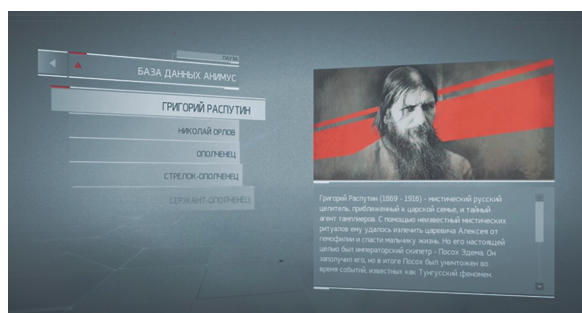
Рис. 2. Игровая биография Г. Распутина

Мотивы действий представителей обеих ведущих фракций игры связаны преимущественно со стремлением обрести контроль над предметами, оставшимися от цивилизации Предтеч. Так, Г. Распутин, согласно исторической мифологии игры, представлял собой агента Тамплиеров, пытался завладеть артефактом «Посох Эдема», использованным для создания скипетра российских императоров (рис. 2).